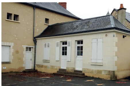
Rénovation du groupe scolaire : avant...

Suite aux actions engagées, la commune de Sepmes a vu baisser sa facture énergétique globale de 27%, soit 11 000 € d'économies chaque année . À elle seule, la rénovation du groupe scolaire a permis une baisse des consommations de gaz de 52%, soit une baisse des dépenses de l'ordre de 62% (4 000 € d'économie) !