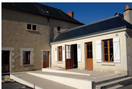
... et après !

Cependant, la démarche de Sepmes ne s'arrête pas là pour autant : la commune, en effet, souhaite désormais sensibiliser ces citoyens à la bonne utilisation des bâtiments, à l'utilisation d'éco-gestes dans leur enceinte ainsi qu'à la maison. Cette démarche exemplaire de la commune de Sepmes engendre aujourd'hui l'adhésion au CEP des communes limitrophes.