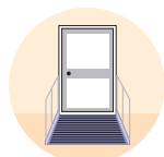
Rampe d'accès extérieur