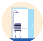
Douche de plain-pied